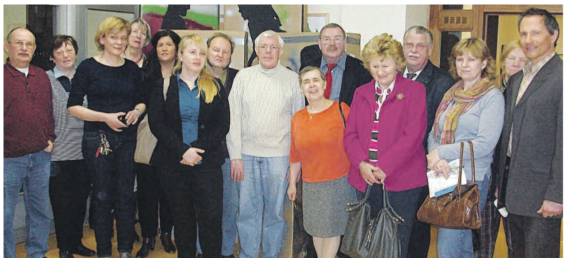
Beim Ortstermin in der Jugendkunstschule in der Nordhauser Straße 22.