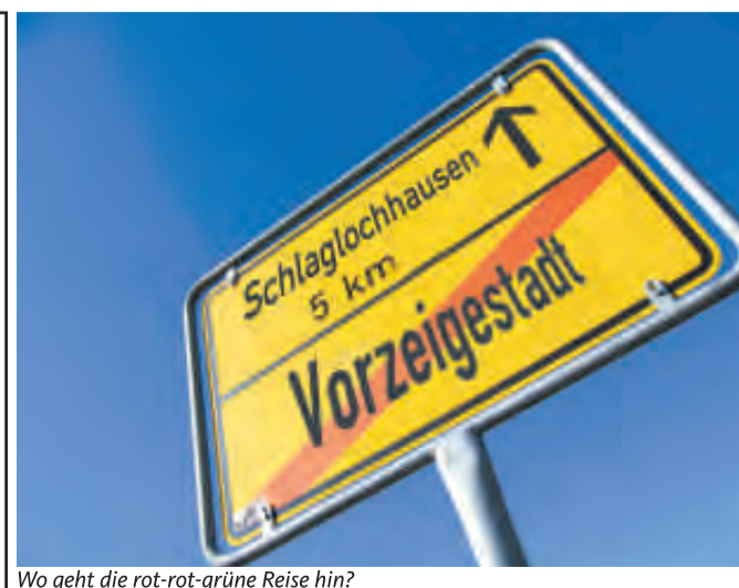
Wo geht die rot-rot-grüne Reise hin?