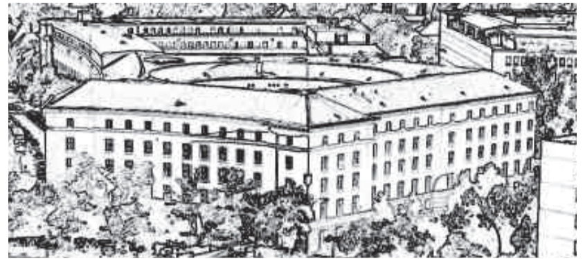
Rathaus Wilmersdorf am Fehrbelliner Platz