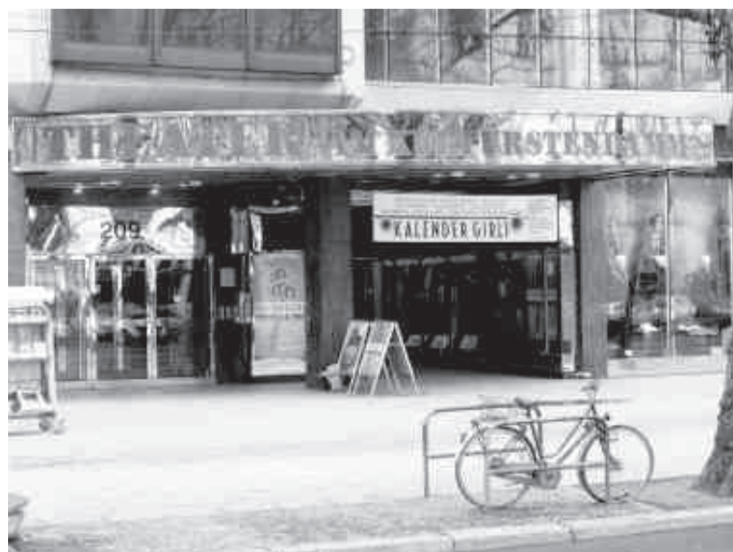
In Zukunft wird es nur noch eine Ku'Damm-Bühne geben.

Hoffen wir, dass im Ergebnis wenigstens der Bestand eines Theaters am Kurfürstendamm dauerhaft gesichert werden kann!