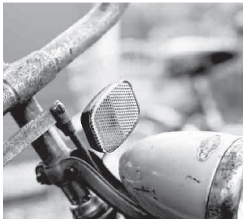
Eine funktionierende Bremsen und eine intakte Lichtanlage mindern das Unfallrisiko im Straßenverkehr.