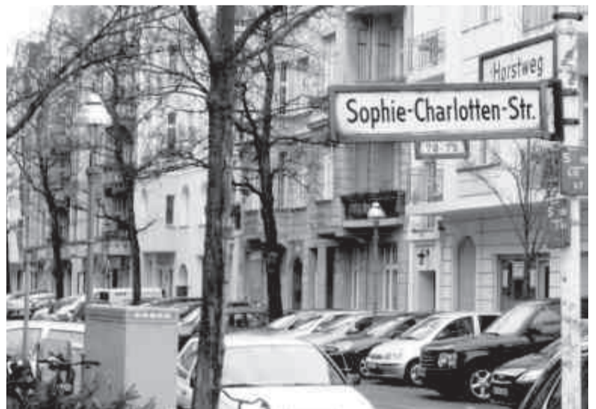
Können die Anwohner des Horstwegs bald auf weniger Straßenlärm hoffen?

90/Die Grünen), über die Wohnungslosen- und Kältehilfe in unserem Bezirk berichten lassen. Auch in unserem Bezirk sind immer mehr Menschen auf Hilfsangebote angewiesen, während gleichzeitig die finanziellen Zuschüsse für die bestehenden Projekte gekürzt werden. Die CDU-Fraktion wird sich auch weiterhin dafür einsetzen, dass, trotz Haushaltssperre und unzureichender finanzieller Zuweisungen von Seiten des Senats an die Bezirke, die Belange der Obdachlosen und Hilfebedürftigen in unserem Bezirk berücksichtigt werden.